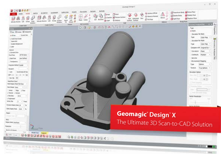
Geomagic Design™ X The Ultimate 3D Scan-to-CAD Solution