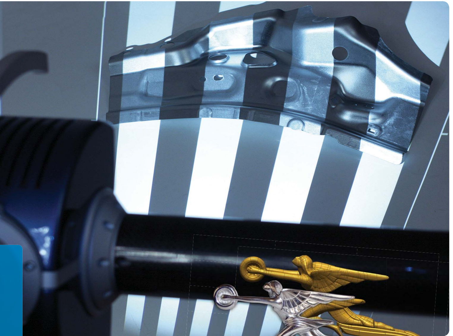
특허 받은 미니어처 투영기술(MPT) 방식을 사용한 빠르고 정확한 3차원 스캐닝